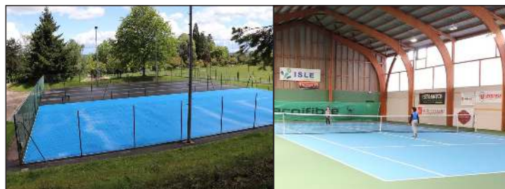
Des courts refaits à neuf au TC Isle