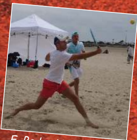
E. Bodard/D. Centeno