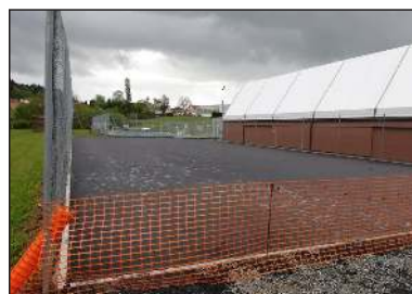
Un nouveau court pour le TC Chateaufort-Linars

Enfin! La nouvelle structure couverte de Pierre-Buffière a été inaugurée en présence du Préfet, du Président du Conseil départemental, du Président de la communauté de communes et des instances du tennis Fédéral et Départemental.