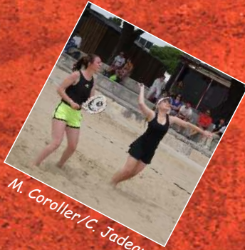
M. Coroller/C. Jadeau