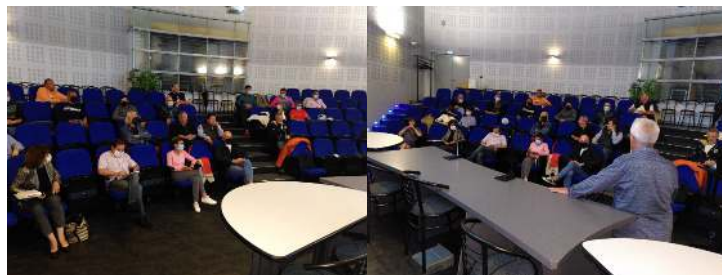
Assemblée studieuse à Chéops

Au cours de la réunion, le comité directeur a notamment abordé l'ensemble des aides susceptibles d'être accordées au Clubs : - ANS