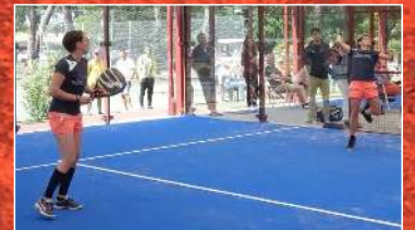
S. Douchet/J. Cazaubon