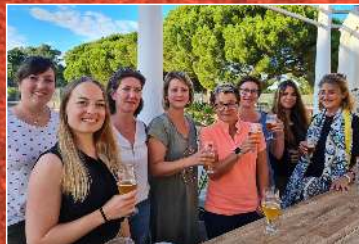
Délégation féminine Haut-viennoise aux régionaux de Padel