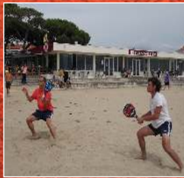
T. Gourinel/S. Reigue