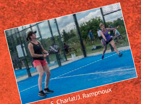
S. Charlat/J. Rampoux